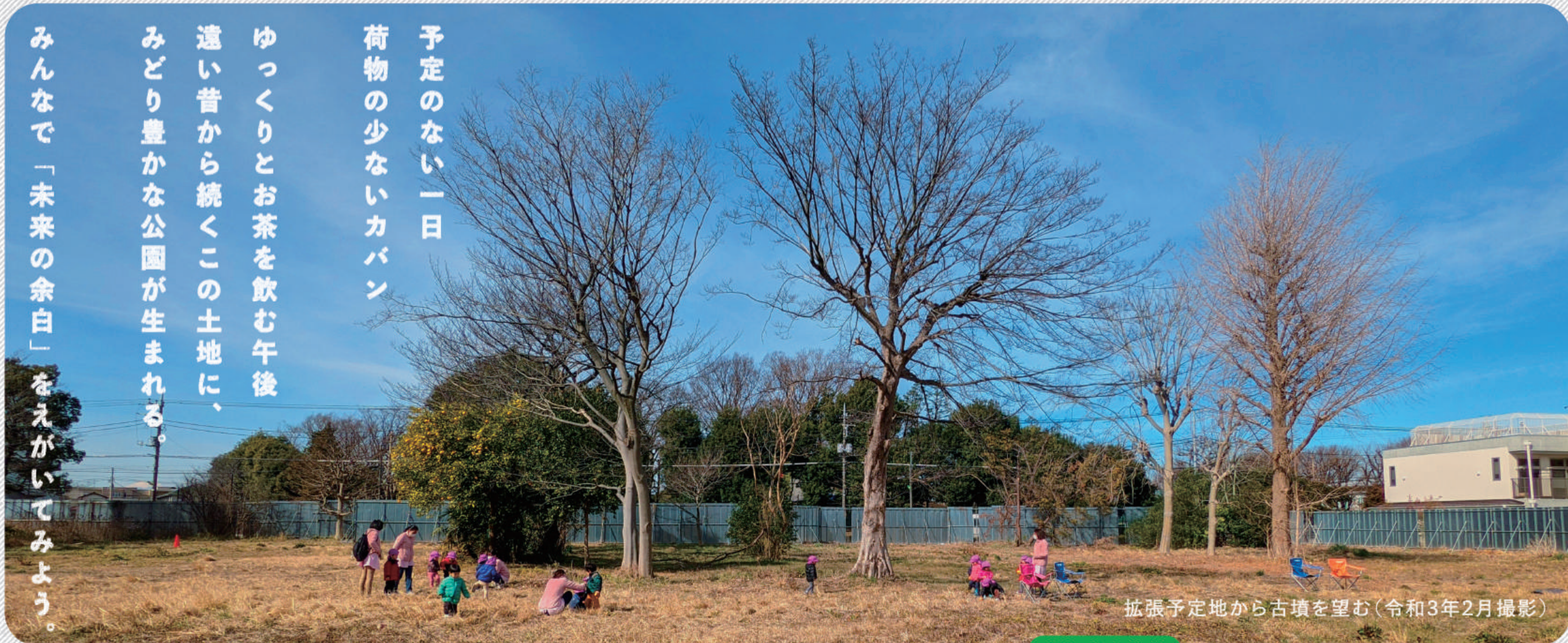
拡張予定地から古墳を望む(令和3年2月撮影)

みんなで「未来の余白」をえがいてみよう。 みどり豊かな公園が生まれる。 遠い昔から続くこの土地に、 ゆっくりとお茶を飲む午後 荷物の少ないカバン 予定のない一日