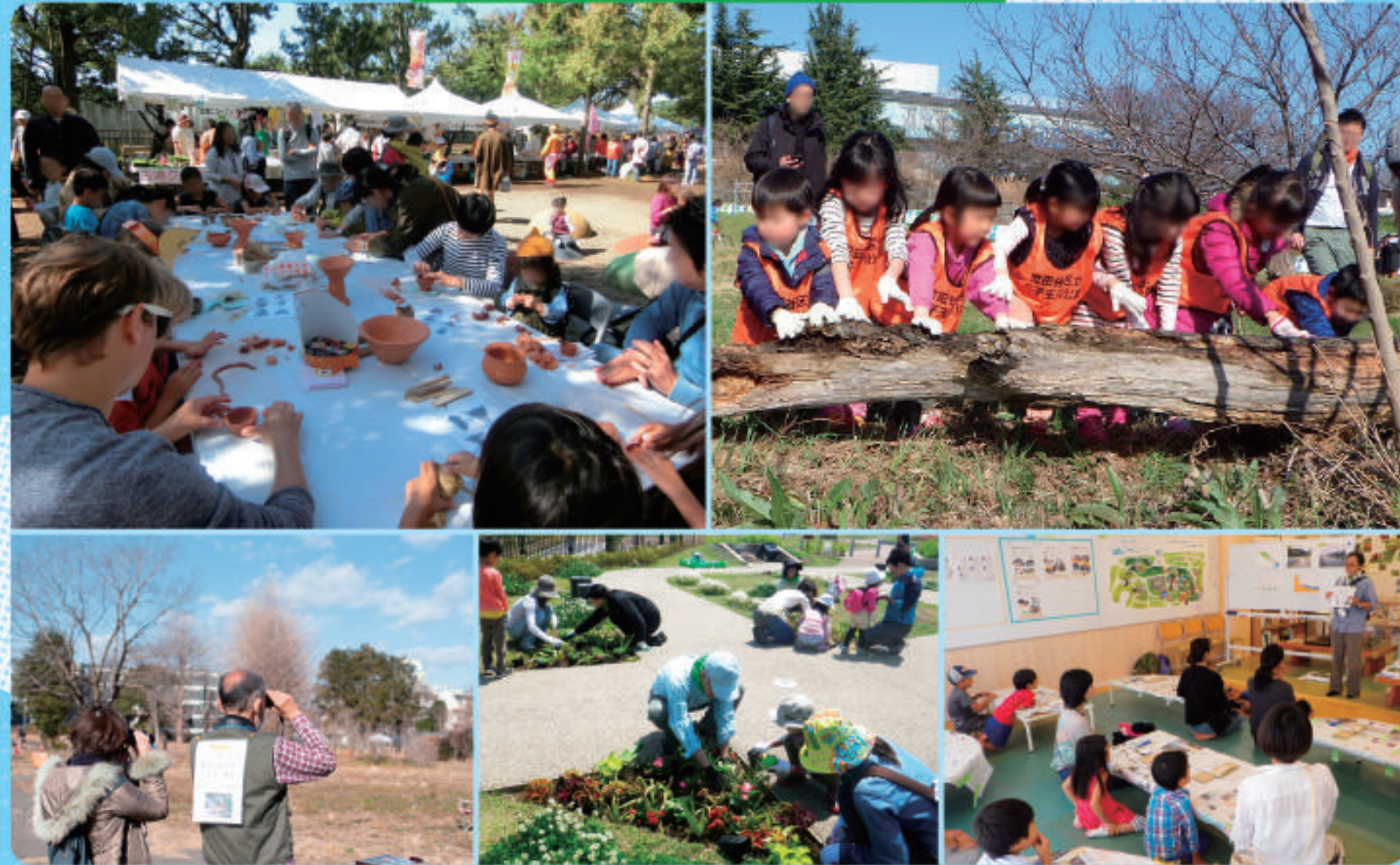
〈これまでのワークショップでいただいた公園活動についての意見〉

花壇づくり／森づくり／雑木林を育てる／ボランティアによる自然や野鳥観察のガイド／古墳のガイド／土器づくり／古代キャンプ／古墳まつり／生き物の棲み処づくり／ミツバチを育てる／ヤギを飼う／清掃活動／イベントの開催／ワークショップの開催／たき火、火起こし／キャンプ／野外料理／ベンチやクッションの貸出／子どもたちの遊びの場／地域防災活動／公園のルールづくり／発表できる場／プレイパーク／サードプレイス／シェアリビング／ナレッジシェア／マルシェ／キッチンカー／テレワークができる／コミュニティの場／公園のつくりを考えるなど