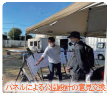
パネルによる公園設計の意見交換