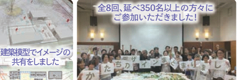
建築模型でイメージの共有をしました 全8回、延べ350名以上の方々にご参加いただきました!

第8回 10月1日(土)建築デザインの共有 第7回デザインDAYのご意見をふまえ、拠点施設の設計内容を整理し共有しました。公園での使い方をイメージしながら、良い点、気になる点などの意見交換を行い、最終的に拠点施設の建物設計(案)をとりまとめました。