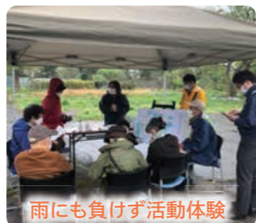
雨にも負けず活動体験