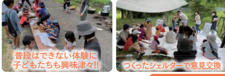
普段はできない体験に子どもたちも興味津々!! つくったシェルターで意見交換 プログラム内容 先着30組の親子が参加! ・火起こし体験 ・ポリ袋で簡単、防災クッキング ・木々を使ったタープ張り ・採取した植物で草木染め

第12回 8月7日(日) スペシャルアクティブDAY 野外活動を体験する「夏の特別企画」を実施。防災時の炊き出しやシェルターづくりなど、野外での火や水の使い方を体験し、公園の災害時の役割について親子で学びました。