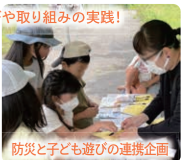
防災と子ども遊びの連携企画