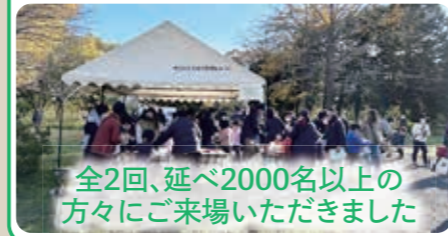
全2回、延べ2000名以上の方々にご来場いただきました

区民発意の取り組みの実践・検証をしました。新緑、紅葉など季節ごとのみどりのなかで様々なプログラムを区民の皆さんと楽しみました。