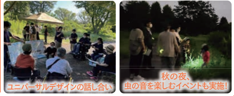
ユニバーサルデザインの話し合い 秋の夜、虫の音を楽しむイベントも実施!

第13回 9月4日(日)| 8日(木) 公園には子どもから高齢者、障がいのある方など様々な人が訪れます。様々な人と現地を歩き、ヨガなどの活動体験を行うなかで、多くの人がより楽しめる公園整備の工夫や運営のあり方の意見交換をしました。