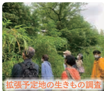
拡張予定地の生きもの調査