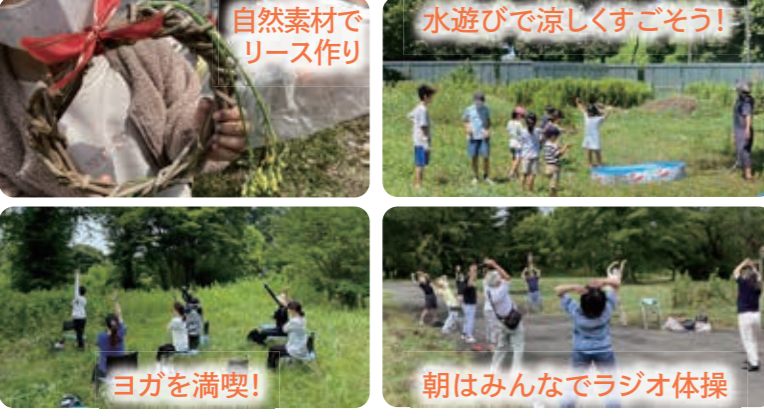
自然素材でリース作り 水遊びで涼しくすごそう! ヨガを満喫! 朝はみんなでラジオ体操

第11回 7月3日(日)| 14日(木) 14日は地域活動の一環として、社会福祉協議会等によるラジオ体操もスタート!少しずつ活動の輪が広がっています。