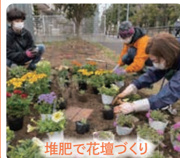
堆肥で花壇づくり

活動開始から6か月経過し、様々な取り組みが少しずつ発展・連携しています。公園を活用した地域循環を考える取り組みなどがスタートしました。