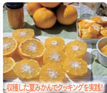
収穫した夏みかんでクッキングを実践!