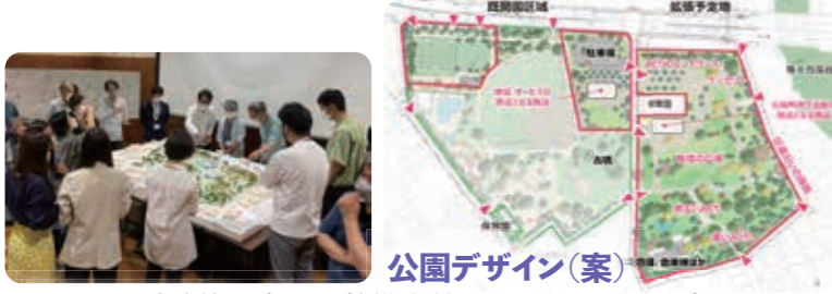
公園デザイン(案) 既開園区域改修に向けた整備方針と、テニスコートを含むスポーツ広場の配置計画案も提示。

6回 6月11日(土)公園デザインの確認 基本設計(検討案)のアンケート結果や現地の意見交換を踏まえた、玉川野毛町公園ならではのランドスケープデザインの工夫や設計の意図をお示しし、公園の将来像を共有しました。提示した公園デザイン(案)を進めることを参加者で確認しました。