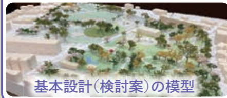
基本設計(検討案)の模型

これまでに5回開催、延べ約300名に参加いただき、グループワークや現地での空間体験、設計者との対話を通して、令和4年2月に公園デザインの基本設計(検討案)をとりまとめました。