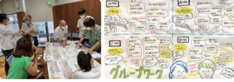
いただいた主なご意見 ・(1人や親子、障がいのある方など)利用する人の立場で建築機能を配置するべき ・公園や古墳になじむ景観の建物 ・みんなが居心地のよい空間づくり など

第7回 8月6日(土)建築機能を考える これまでの意見やアクティブDAYでの実際の活動内容を反映した拠点施設の設計案3案を共有しました。公園での使い方をイメージした諸室の機能・配置・公園全体との繋がりなどを意見交換しました。