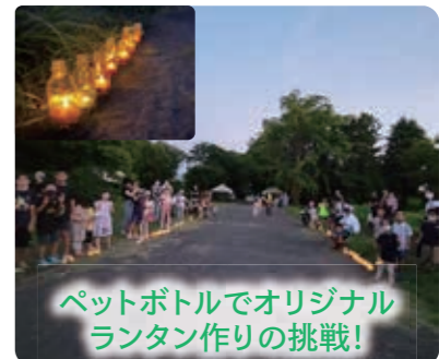
ペットボトルでオリジナルランタン作りの挑戦!