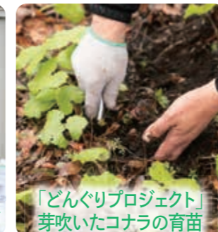
「どんぐりプロジェクト」芽吹いたコナラの育苗