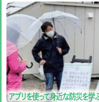
アプリを使って身近な防災を学ぶ

これまでの活動報告や身近な防災について学ぶ企画など、8つの活動プログラムを実施。4月3日には、新たに「どんぐりプロジェクト」として、区民によるみどりを育てる活動が始動しました。