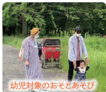
幼児対象のおそとあそび