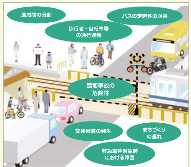
「開かずの踏切」のイメージ図

今回のまちづくり通信では、事業概要と各駅周辺の街づくりについてお知らせいたします。