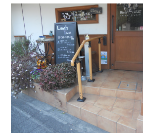
段の部分に手すりを設置した例