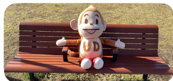
世田谷区ユニバーサルデザイン普及啓発キャラクター「せたちち」