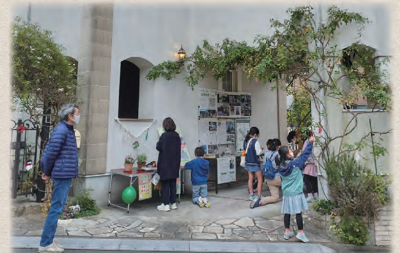
庭先をお借りしてスタンプラリーと工作の会場に。