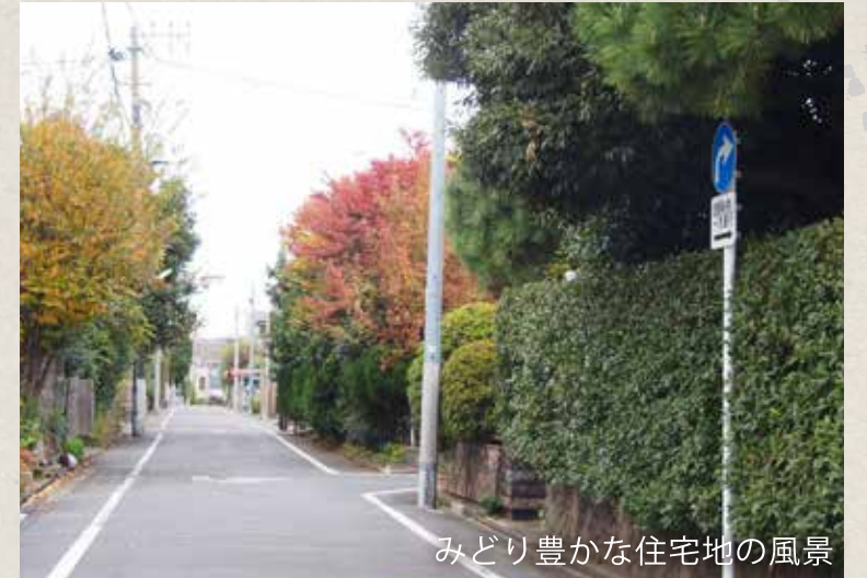
みどり豊かな住宅地の風景