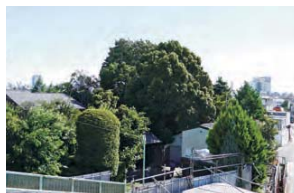
4 ランドマークとなる高木も多い、みどりの豊かな地域です。