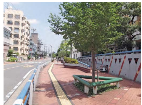
豊かな色彩でデザインされた歩道空間

段差をなくし、色彩や形状をデザインするなど、だれもが安全で快適に歩ける歩道空間を整備することで「やさしいまちづくり」が進められてきたエリアです。