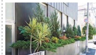
15 変化に富んだみどりが通りを演出しています。