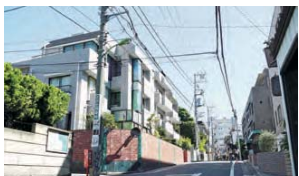
8 起伏ある地形が、街に変化を与えてくれます。