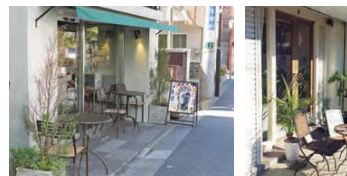
11 商店の主な対象は歩行者で、各店舗が個性的に店先を演出しています。