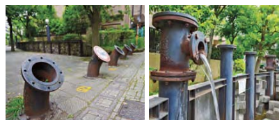
水道管を活用した車止め