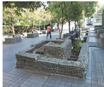
かつての水路のイメージを再現