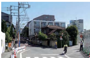
7 駅と駅の中の谷地部分が、道路の結節点となっています。