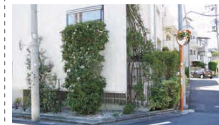
14 敷地を有効に使ってみどりを育てる工夫が感じられます。