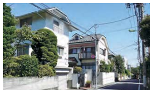
5 低層住居系地域のため、静かな環境の住宅地が広がっています。