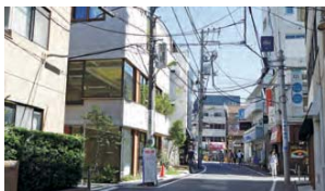
9 低層住宅地の静寂と下北沢駅付近の賑わいが共存する地域です。