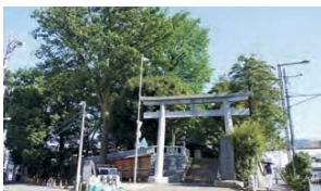
2 代田小や代田八幡神社等、地域コミュニティの場が存在します。