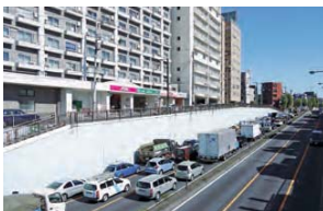
1 自動車通行量の多い交通の要衝となっています。