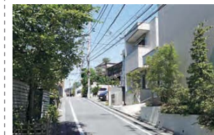
13 都心に近いにも関わらず、落ち着いた住宅地が広がっています。