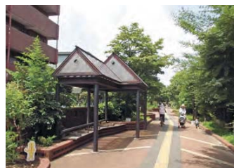
緑道の屋根つきベンチ