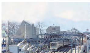
3 台地上の地形に位置し、富士山を眺望することもできます。