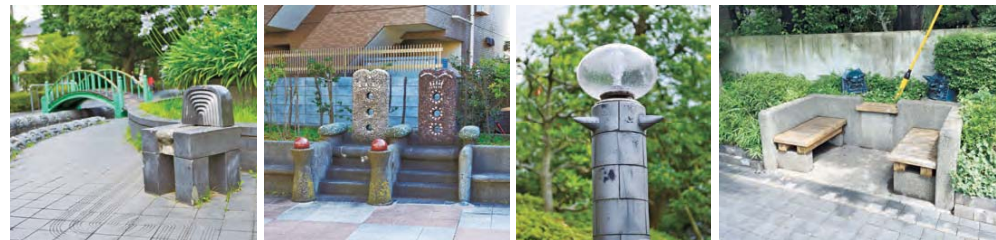
様々なベンチとモニュメント