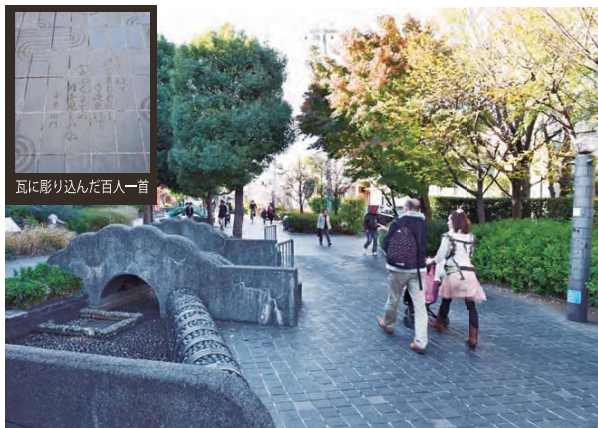
みどりに囲まれた瓦の道（みちのホール）

かつて流れていた水路を歩道のデザインとして活用したり、みちの広場、みちのギャラリー、みちのホールなど、新しく楽しい道路空間をつくりだしています。