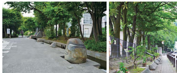
学校と通りを結ぶ空間