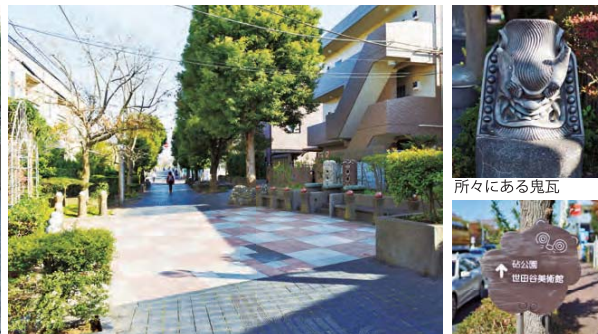
チェス盤調の舗装とベンチ（みちのサロン）