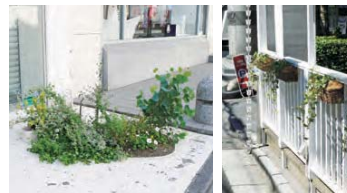
10 店先を利用した、工夫されたみどりが目を引きます。