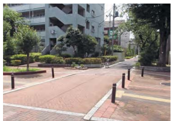
段差のない交差部分