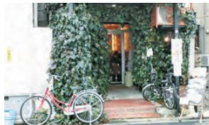
6 店舗は多くありませんが、個性的な兼用住宅が点在しています。