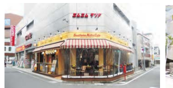
12 細かな道が交差する辻々では、角地も効果的に使われています。