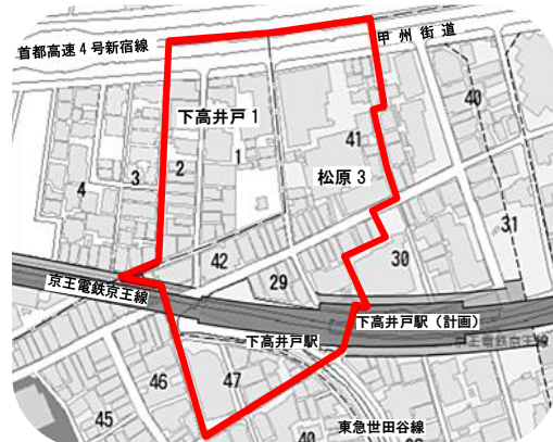
街づくり懇談会の対象範囲図