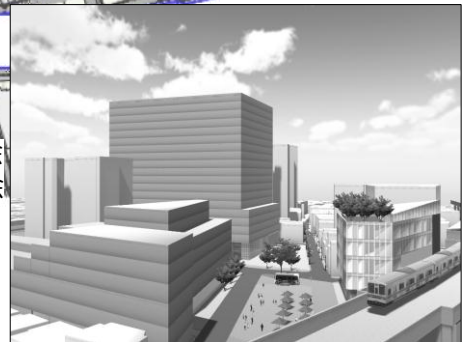
VR映像のイメージ（計画）

※各勉強会の範囲については、街づくりの進捗により変わる可能性があります。各勉強会は、平成30年度も継続して開催する予定です。