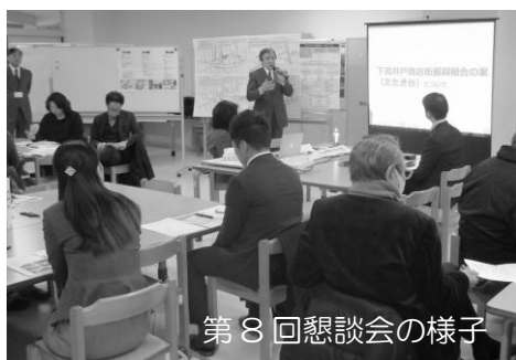
第8回懇談会の様子

下高井戸駅周辺では、京王線連続立体交差事業を契機に街づくりの検討を進め、平成25年度に、世田谷区では「地区街づくり計画」を、杉並区では「地区まちづくり方針」を策定しました。