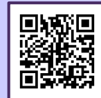
禅文化歴史博物館HP

WEBを活用した展示や動画コンテンツの公開を行っておりますので是非ご覧ください。