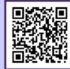
禅博デジタルコンテンツ