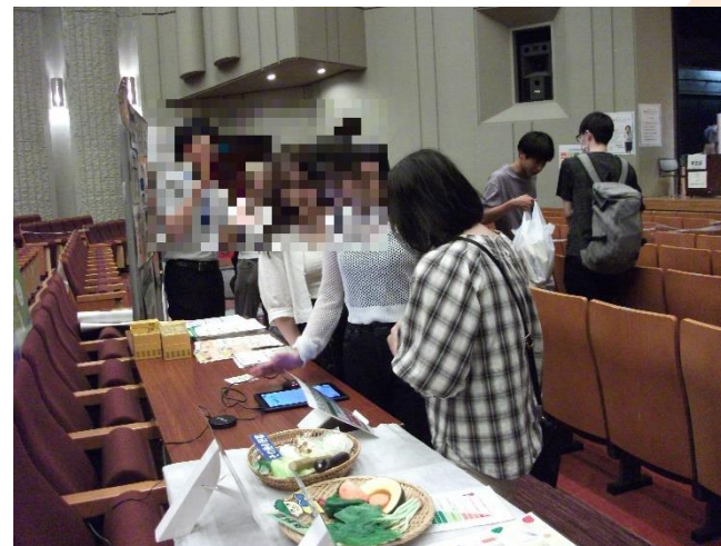
推定野菜摂取量を測定している様子

駒澤大学で開催された「駒澤大学カラダスマイルプログラム」において、世田谷保健所と世田谷・玉川総合支所の栄養士による栄養相談を行うとともに、大塚製薬株式会社提供の健康啓発教材等を使用した、食育啓発事業を実施した（7月19～21日、延べ参加人数984名）。「1日に必要な野菜量がわかった」「炭水化物ばかり食べがちになっていたので食生活の見直しになった」など学生自身で食生活を考えるきっかけになった。