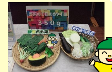
野菜の1日のめやす量