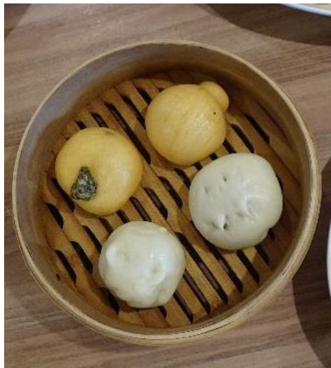
オリジナル中華まん

東京山手調理師専門学校との取組みでは、子どもたち自ら商品のアイデアを出し、オリジナルの中華まんを開発。世田谷グルマンサミット（食フェス）で販売し、すべて完売となった。