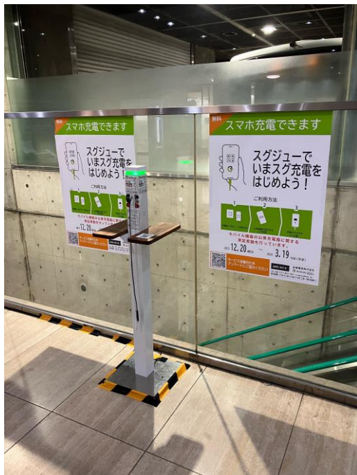
「スグジュー」デモ機

新しい身近な充電インフラとしてのニーズや有効性を検証し、区民サービスの向上に寄与することを目的として、岩崎電気株式会社が新たに開発した「広告付充電コンセントサービス（スグジュー）」のデモ機を北沢総合支所（北沢タウンホール）と烏山区民センターの各1階に設置し、実証実験を実施（12月～令和6年3月）。