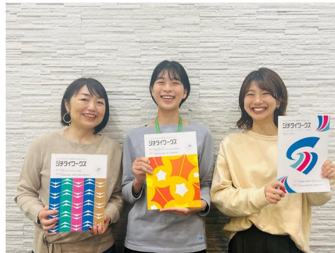
写真中央が区派遣職員

派遣された職員は、全国1788自治体に無料配布している行政マガジン「ジチタイワークス」の企画・制作・発行に関する業務に従事。編集技術を身につけるとともに、仕事を進めるうえでの目的意識の醸成や民間企業のノウハウを吸収した。