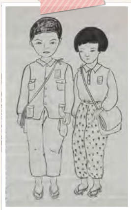
战争时期的儿童服装