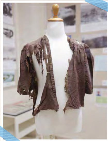
经过原子弹爆炸之后的连衣裙