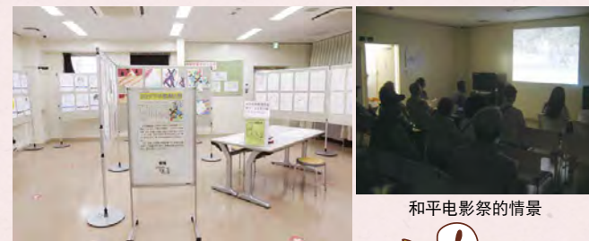
和平电影影的情景

企划展：根据主题进行策划展示和收藏品展示、放映DVD、(每年数次) 开展相关活动等。