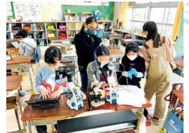
土壌調査から課題意識をもち、環境を守るために 自分ができることを考えています

世田谷区では、子どもたちが将来、社会の中で課題意識をもち、自分の役割を果たしながら、 自分らしい生き方を実現できるようにキャリア・未来デザイン教育を展開していきます。