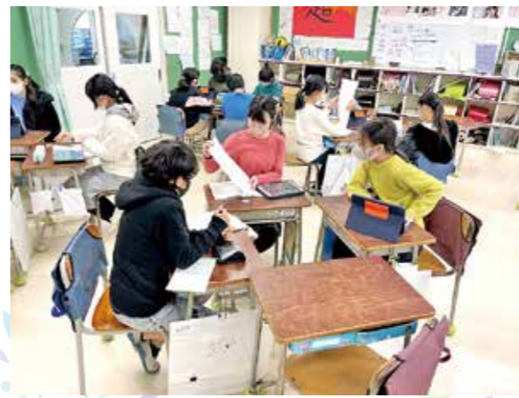
よりよい自然環境について、 グループで議論しています

子どもたちの感想からは、「自らが自然とともにどう生きるか」という課題意識をもち、今後の社会の中 で自分が果たすべき役割について主体的に考えている様子うかがえました。