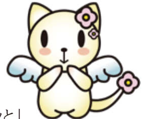
マスコットキャラクター なちゅ

「せたホッと」の活動が開始してまもなく4年となります。その間、関係機関から「せたホッと」の活動を理解していただき、連携も進んできました。