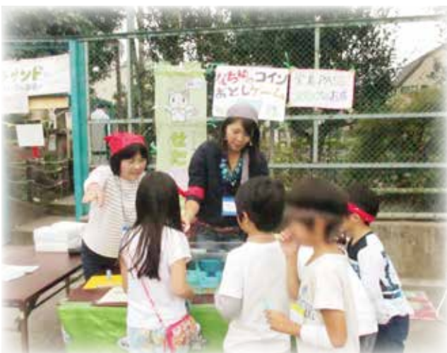
松沢児童館「あそびの宝島」

「せたホッと」は子どもや保護者と周囲の人たちへの支援や働きかけを通して、子どもの権利擁護の実現に向けた努力を続けていきます。