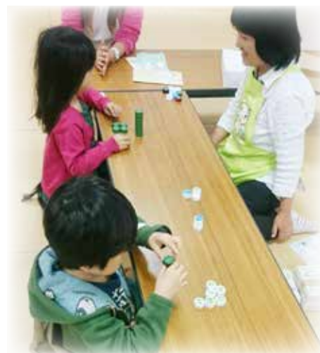
池尻児童館「がやがや村まつり」