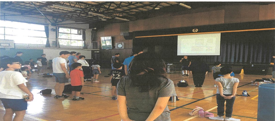
↑ 親子で体を動かしながら講義を受けました