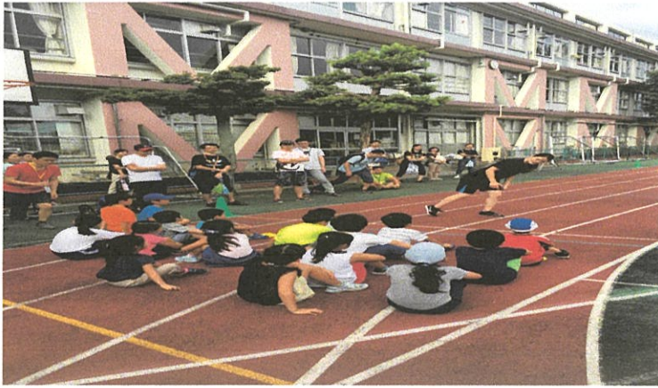
↑スタートの姿勢の練習