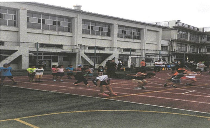
↑走りの中にある飛ぶ動作を意識した練習