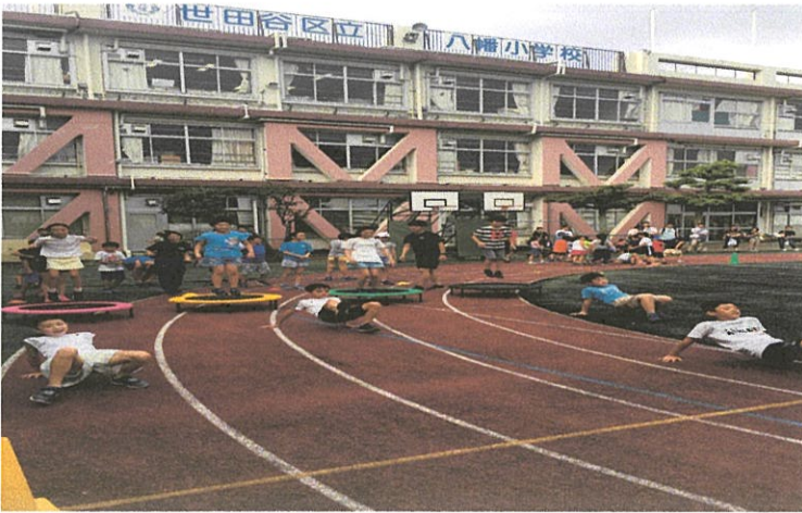
↑トランポリンを使うとともに手足の連動を意識した練習