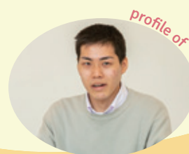
保健福祉センター 生活支援課 (採用2年目)

元々世田谷区には縁はなかったのですが、区が新たに児童相談所を開設すると聞いて、先陣をきって先進的は取り組みをしているところに魅力を感じて志望しました。