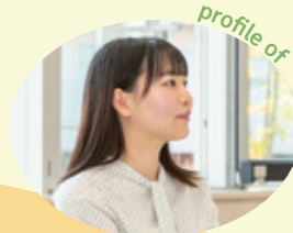
保健福祉センター 保健福祉課 (採用1年目)

世田谷区は同じ職場に事務職の方も多く、ずっと福祉職の世界だけで過ごすよりも、様々な立場から意見を聞けるし、視野が広がり成長できるのではと思います。志望しました。