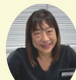
保健福祉センター 子ども家庭支援課長

世田谷区は、人口、世帯数とも23区内第1位のまちです。約92万人の区民が誰一人取り残されることなく生き生きと暮らせる世田谷を目指して、高齢者、障害者、子ども、生活支援等様々な分野で福祉職が働いています。