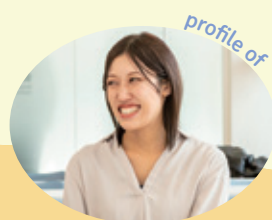
世田谷区児童相談所 (採用3年目)

当初は MSW も志望していましたが、ずっと同じ仕事になるより、区役所なら色々な仕事を体験できると思い志望しました。また大学時代を世田谷区で過ごし、暮らしやすかったのもあります。