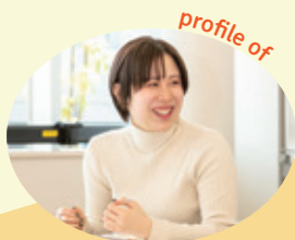
保健福祉センター 子ども家庭支援課 (採用2年目)

確かに、やってみたら思いがけずハマる仕事があるかもしれないので、私も色々な職場を経験したいです。そして知識やスキルを積み上げて、将来は、職場でも住民からも頼られる存在になりたいです。