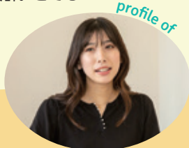
保健福祉センター 保健福祉課 (採用1年目)

世田谷区は同じ職場に事務職の方も多く、ずっと福祉職の世界だけで過ごすよりも、様々な立場から意見を聞けるし、視野が広がり成長できるのではと思います。志望しました。