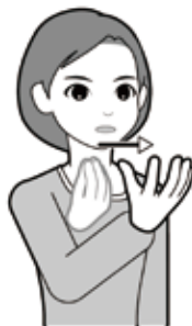
日本手話研究所にて確定した「令和」の表現