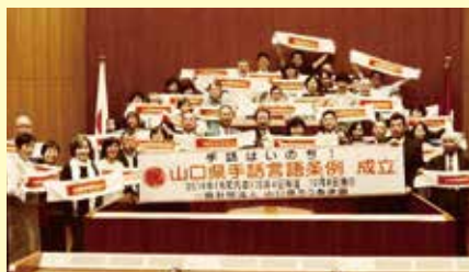
2019年10月4日 「山口県手話言語条例」可決