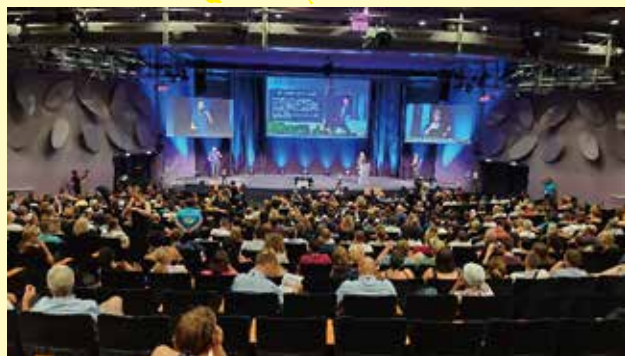
第18回世界ろう者会議(2019年7月・パリ)

決議では、手話言語が音声言語と対等であることを認め、ろう者の人権が完全に保障されるよう、国連加盟国が社会全体で手話言語についての意識を高めるための手段を講じることを促進することが目的であるとしています。