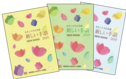
『新しい手話』の書籍発行

手話言語法が制定 されれば、福祉としての活動ではなく、 日本語(国語)と同等な言語として研究が行われるべき です。国立国語研究所という国の機関で日本語や日本語教育について研究が行われているように、 手話言語も国の機関による調査・研究が必要 です。