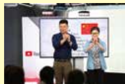
2018年の手話言語の国際デーイベント