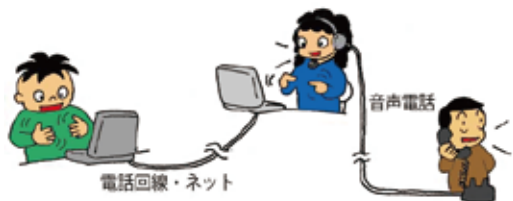
電話リレーサービスのイメージ