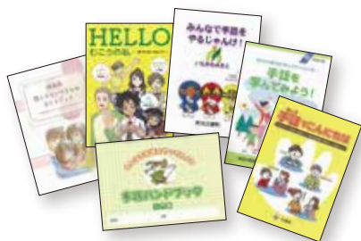
各自治体のパンフレット

手話の普及啓発として、沖縄県「手で話そう運動」PRイベントを実施するとともに、毎月第三水曜日は「手話推進の日」と制定され、県のホームページを通じて簡単な手話が紹介されています。