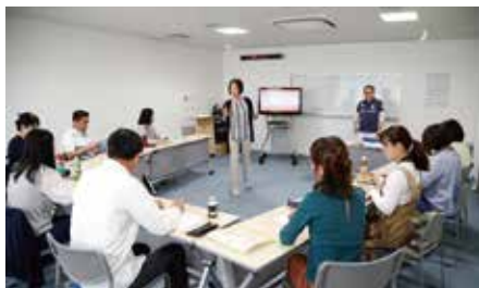
手話通訳者養成講座の様子

現在、手話言語の通訳者は不足し、高齢化が心配されています。手話言語法が制定されることによって、大学等で 語学として手話言語を学ぶ機会の拡大 が期待されます。他の外国語通訳養成と同様に、“ 手話言語通訳者養成 ”のコースが作られ、 手話言語通訳業務に夢とロマンを抱き、職業選択の一つとして手話言語通訳者を目指す若い人達が増えていく と思われます。