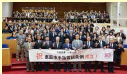
2019年10月10日 北海道「恵庭市手話言語条例」可決