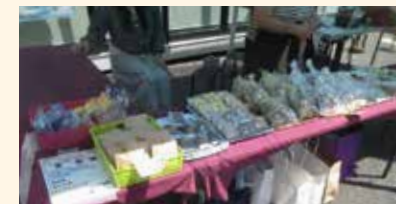
下北沢大学はっぴいハンドメイド