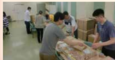
企業広報誌封入作業