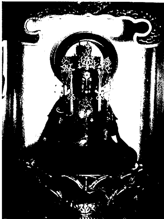
十一面観音の分身で御巡行に使われる

今から400年以上も前になる天正年間 てんしやう （1573～1591）、品川 よりきにはま の寄木浜という海岸で、漁師の網に掛かって引き揚げられたのがこの十一面観音像でした。