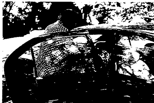
観音様をお迎えに来た世話人

桜木と満中在家は世田谷区の中心部に位置し、旧世田谷町の区域に含まれていました。現在両地域で17軒の家々が観音様の御巡行を行っています。