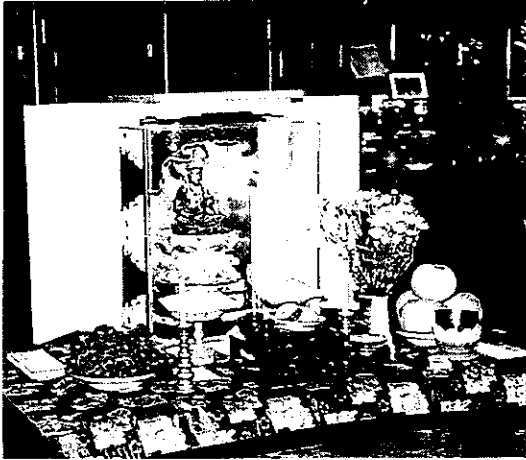
お宿に迎えられた観音様

かつては各村々に かんのんこう 観音講が組織され、それぞれの講に世話人がいたそうですが、桜木と満中在家に観音講という名称は伝えられていないようです。ただし、世話人は桜木と満中在家にそれぞれ1人ずついます。世話人は代々同じ家が務めることになっています。