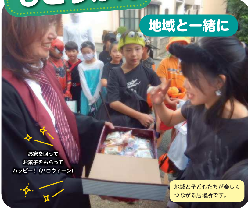
お家を回ってお菓子をもらって ハッピー!(ハロウィン)