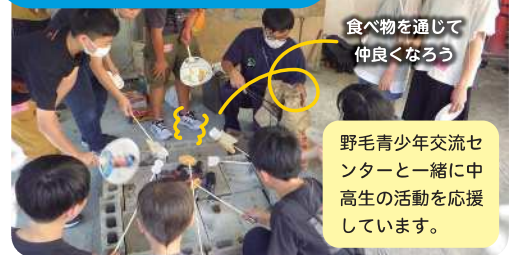
食べ物を通じて仲良くなろう