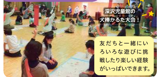
深沢児童館の犬棒かるた大会!