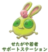
せたがや若者サポートステーション

※メルサポは世田谷若者総合支援センターのメルクマールせたがやとせたがや若者サポートステーションが共同で運営しているプログラムです。