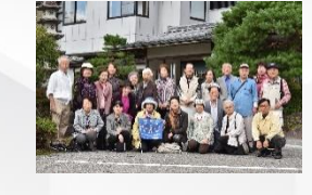
研修旅行もありますよ。

ミニディでは友愛活動の一環として椅子に座って体操したり、お弁当を食べたり、カラオケしたりします。