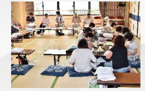
社会奉仕のボランティアで、みんなで雑巾を縫いました。