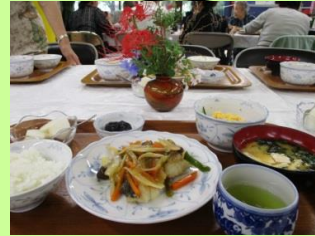
季節の花を楽しみながら楽しく食べます。