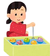
〈イベントでブース担当〉