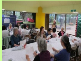
最後は全員で季節の歌を歌います♪