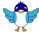
イメージキャラクターあんすこ君 世田谷区の鳥「オナガ」