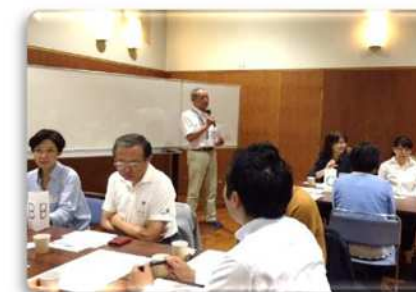
(秋のスペシャルカフェ)

「歯の具合と認知症の関連に驚きました。今後に役立てたい。」とお言葉をいただきました。