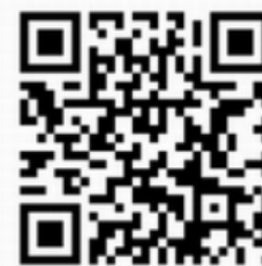
メール配信サービス二 次元コード