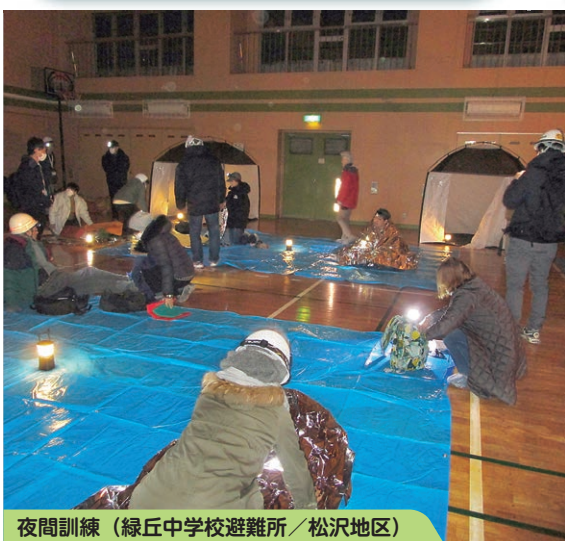
夜間訓練 (緑丘中学校避難所/松沢地区)