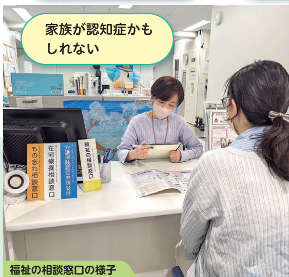
福祉の相談窓口の様子