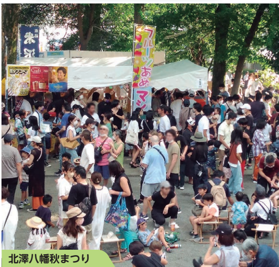
北沢八幡秋まつり