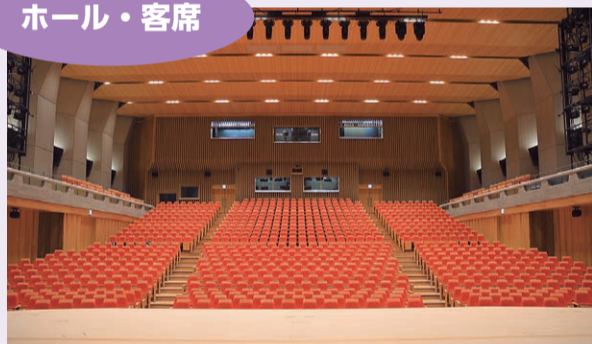
▲舞台上から見た客席