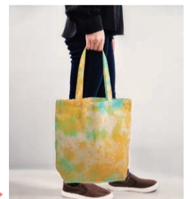
色は当日選べます▶

☎対 小学生と保護者 ☎場 リサイクル千歳台 ☎備 詳しくは、ホームページ( HP https:// ecocycle-setagaya.jp/ )をご覧ください。