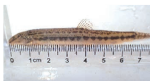
▲ヒガシシマドジョウ