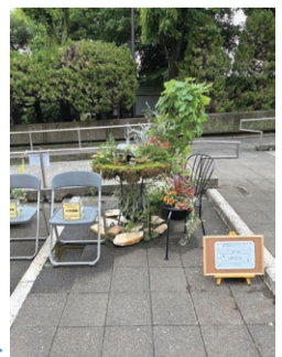
出展作品の一例(昨年度展示)▶

日 6月1日(土)、2日(日)いずれも午前10時~午後4時(雨天実施) 場 世田谷公園 担当=みどり政策課 申 4月15日までに、電話、ファクシミリまたはメール(記入例3面)で、せたがやガーデニングフェア実行委員会(☎3322-5090 FAX3325-8590 ①satoru.saito@ryokushin-zoen.co.jp)へ 先着12人 区HPQ 207903