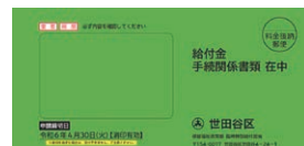
10万円給付の確認書兼申請書 封筒