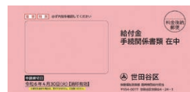
7万円給付の確認書兼申請書 封筒