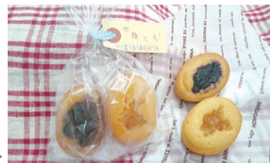
世田谷区産夏みかん、川場村産ブルーベリーを使った、しっとりとした食感が特徴の焼き菓子▶

備詳しくは、区HPQ 182525 をご覧ください。担当=区民健康村・ふるさと・交流推進課