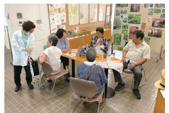
▲ぶんぶくテラマチの様子