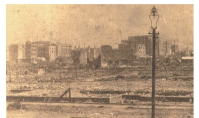
▲東京駅前の焼け跡、日本橋方面