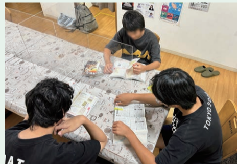
▲児童養護施設の子どもの様子