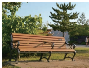
二子玉川公園に寄附いただいたベンチ▶

寄附者名やメッセージ入りのプレートを取り付けます。お祝いの記念や願いを込めて、ぜひご検討ください。 設置場所 / 世田谷公園、羽根木公園、駒沢緑泉公園、大蔵運動公園、上祖師谷パンダ公園 価格 / 23万円(二人掛け)、20万円(一人掛け) 募集期限 / 10月13日 備 詳しくは、区のホームページをご覧ください。 問 公園緑地課 ☎6432-7908 FAX6432-7989