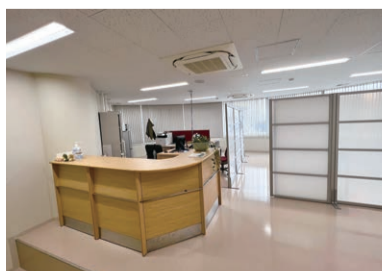
▲児童相談所3階に事務室があります