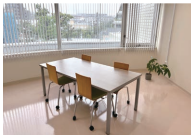
▲相談スペースでお話をお聞きます