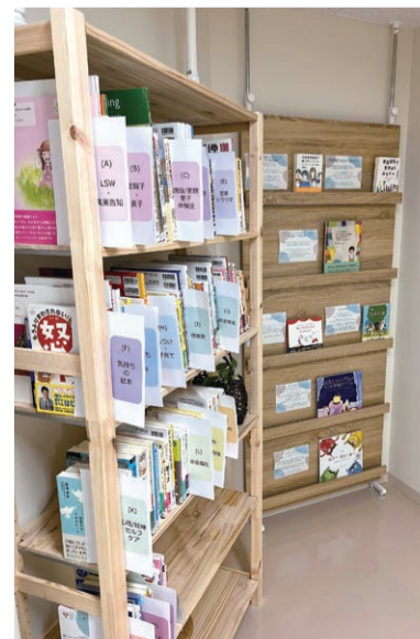
▲里親や社会的養護にかかわる書籍の貸出を行っています