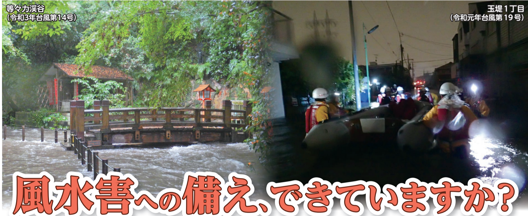
玉堤1丁目 (令和元年台風第19号)