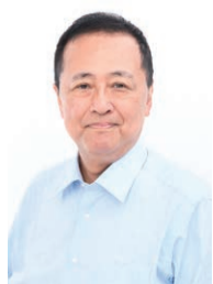
世田谷区長 のぶと 保坂展人

主な内容▶ 無料クーポン券による風しん抗体検査・予防接種…3面 | 子どもを地域で支えましょう 社会的養護の子どもたち…6・7面 | 「車座集会」を開催します(6月・7月上旬実施分)…12面