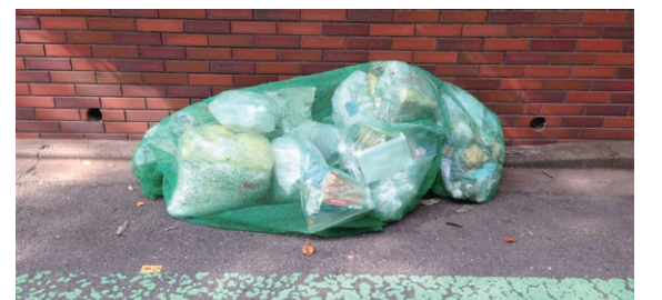
▲ごみ袋がネット内に収まるように、ネットの周囲をごみ袋の下にしっかりと巻き込んでください