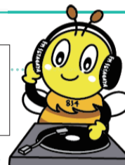
エフエム世田谷のキャラクター「DJせたハチ」▶