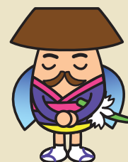
上町地区キャラクター「代官ホタルン」

担当=世田谷総合支所地域振興課地域振興・防災担当 ☎ せたがやコール ☎03-5432-3333 FAX03-5432-3100