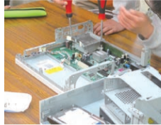
楽しい分解体験をしよう▶

申 11月4日 (必着) までに、往復ハガキ (記入例参照。①②の別も明記)、またはホームページからリサイクル千歳台 (〒157-0071 千歳台1-1-5 ☎5490-1020 FAX5490-3267 https://ecocycle-setagaya.jp/ ) へ 抽選各6組 (親子2人1組)