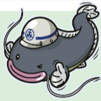
▲ 世田谷区防災キャラクター「じじよすけ」