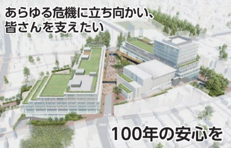
あらゆる危機に立ち向かい、皆さんを支えたい