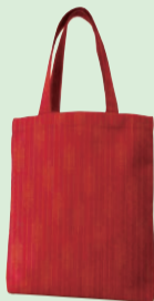
新区民会館ホールの座席の生地を使用したトートバッグ（区外の方限定のお礼の品）▶

◀ 寄附へのお礼として、区民会館エントランスホール（左図）のレリーフ裏の銘板への氏名掲出や、工事現場見学ツアーをご希望いただけます（区民の方もお選びいただけます）