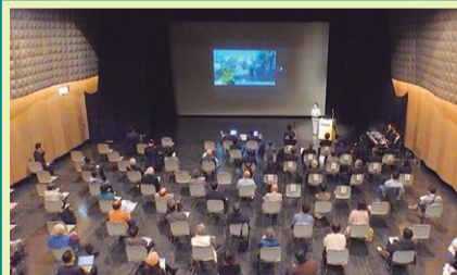
北沢デザイン会議