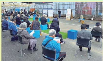
シモキタリングまちづくり会議 (旧北沢PR戦略会議)