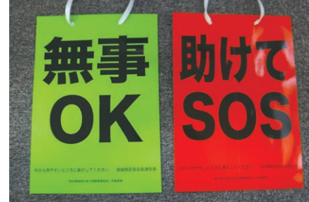
▲「無事OK」を見えるところに掲示してください

内容/事前配布している緑色の安否確認標識を終日戸外に掲示し、近隣の方へ安否を表示する訓練 対成城地区に自宅・事業所等のある方 日9月1日(休) 問成城センター ☎3482-1348 FAX3482-7208