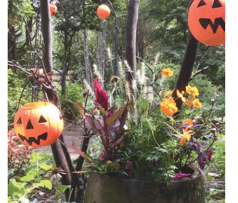
▲季節に合わせた飾りつけも行えます

内容/秋の植物の植え込み、コンポスト、園路補修、ガーデニングやDIY作業の体験等 日9月12日、10月17日いずれも月曜午前10時~正午(雨天中止) 場成城三丁目こもれびの庭市民緑地(成城3-6-20) 申いずれも開催1週間前までに、電話またはファクシミリ(記入例参照)で(一財)世田谷トラストまちづくり(☎6379-1624 FAX6379-4233)へ