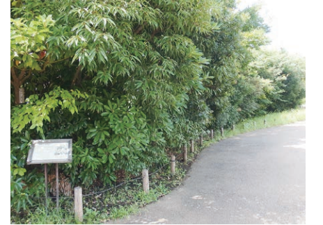
▲森の生長の様子を感じてみませんか

9月9日に、二子玉川公園内のいのちの森が植樹から10周年を迎えます。森の生長の様子を間近で感じてみませんか。 問二子玉川公園ビジターセンター ☎3700-2735 FAX6805-7591