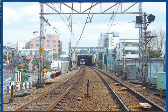
小田急線地下化前の様子

① 高低差のある地形を活かし、雨水が溜まる広場や災害時のための防水水槽を備えるシモキタ雨庭広場(7月オープン)