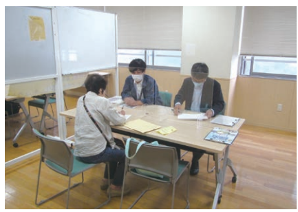
▲お気軽にご相談ください