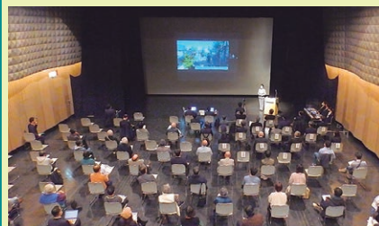
北沢デザイン会議