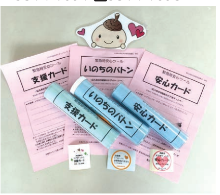
▲いざという時のための備えが大事です

上北沢地区「支援カード」、上祖師谷地区「いのちのボタン」、烏山地区「安心カード」の名称で、下記問い合わせ先で配布しています。