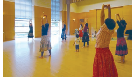
▲ママと一緒に楽しい体操

費2500円 2秋の子育てママ体操教室(全4回) 対1歳以上の未就学児と母親で全回参加できる方 日11月4~25日の毎週金曜午前10時~11時30分 講保健センター運動指導員 場鎌田区民センター 申②は10月10日までに、①②とも電話またはファクシミリ(記入例参照)で鎌田区民センター(☎3709-4311 FAX3709-4322)へ 先着110人232組