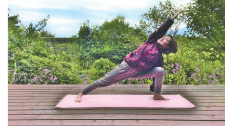
▲無理なく体を動かしましょう!