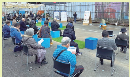
シモキタリングまちづくり会議 (旧北沢PR戦略会議)