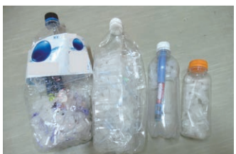
▶不適切な排出例： 工場で見つかった注射針が入ったペットボトル