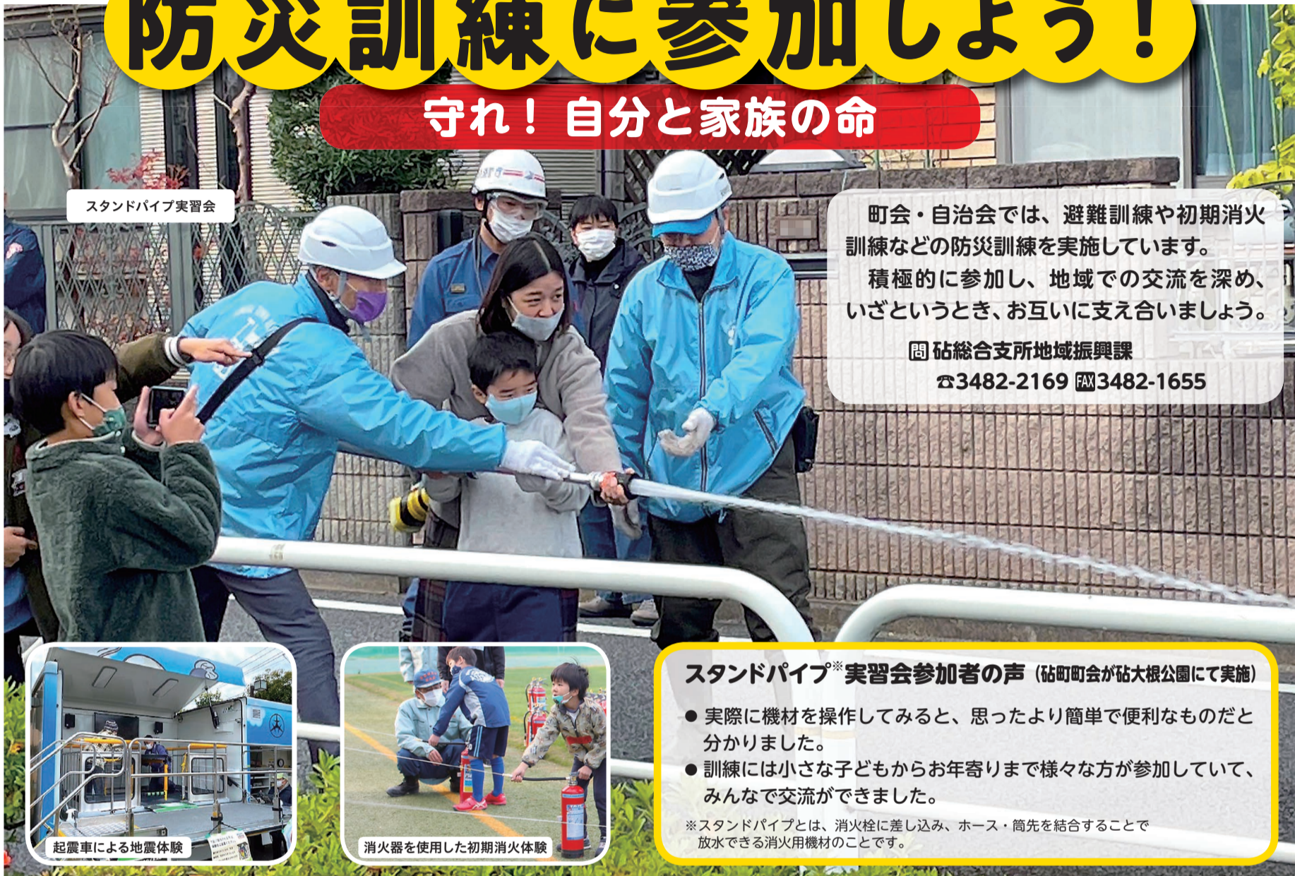
スタンドパイプ実習会

町会・自治会では、避難訓練や初期消火訓練などの防災訓練を実施しています。積極的に参加し、地域での交流を深め、いざというとき、お互いに支え合しましょう。