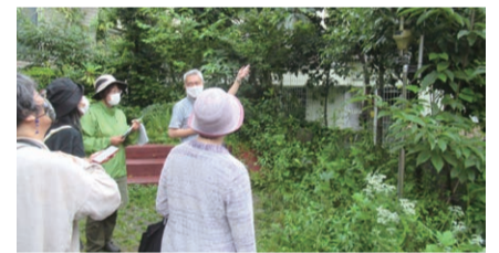
▲生きものとの共生をめざすエコガーデンについて解説中

谷トラストまちづくり(☎6379-1624 FAX6379-4233)へ 抽選15人