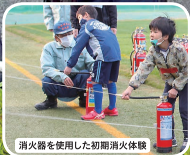
消火器を使用した初期消火体験