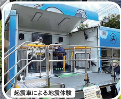
起震車による地震体験

*スタンドパイプとは、消火栓に差し込み、ホース・筒先を結合することで放水できる消火用機材のことです。