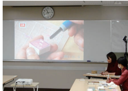
▲講師の手元をスクリーンに投影して彫り方を解説しました