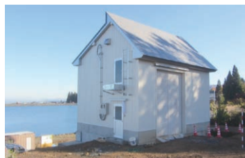
▲津南町(新潟県)…小水力発電