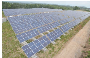
▲弘前市(青森県)…太陽光発電