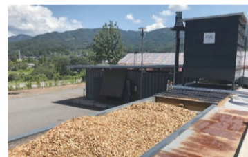
▲川場村(群馬県)…木質バイオマス発電