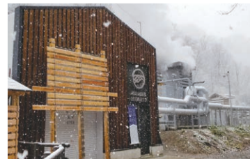
▲十日町市(新潟県)…地熱発電