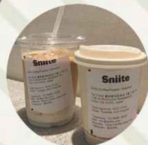
協力 制作：駒繫小学校 6年生 下馬いせやさん torseさん Sniteさん lueurさん FUNGOさん Vin stockさん