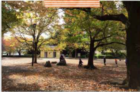
下馬中央公園 (2022年11月5日撮影)