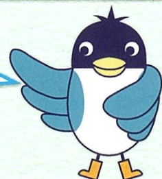
あんすこ君 あんしんすこやかセンター イメージキャラクター