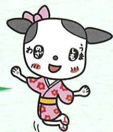
しものごワン 下馬・野沢地区キャラクター