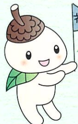
ココロン 世田谷区協 キャラクター