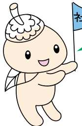
ココロン 世田谷区社協 キャラクター