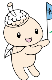
ココロン 世田谷区社協 キャラクター