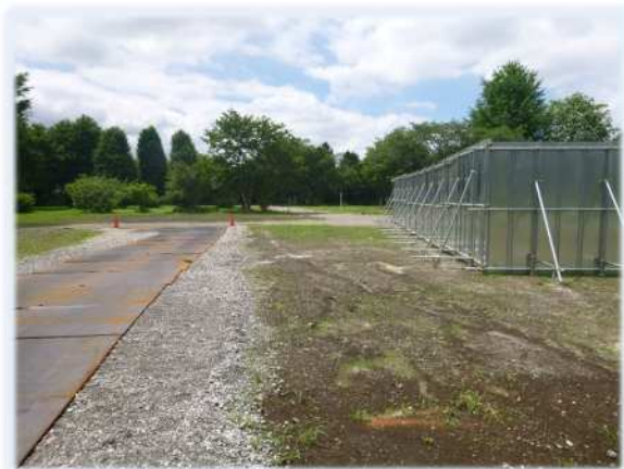
園内北側から南側を望む

以上を踏まえ、これより、住民の皆様や事業者と対話をしながら公園計画づくりを進めてまいります。