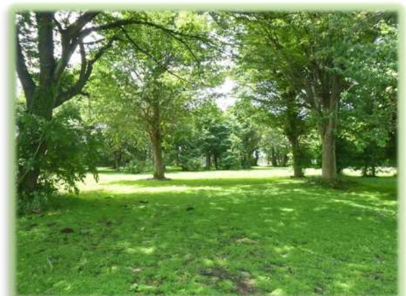
園内南側の樹林地の様子